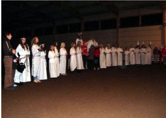
Vårat fina Luciatåg

År 2006 föll det sig så bra att det låg en klubbävling i dressyr inplanerad den 10 december, alltså precis dagarna innan Lucia. Då tog USEK chansen och organiserade ett luciatåg som fick visa sitt framträdande i pausen mellan klasserna. Med luciahästen Silver Dream i spetsen gjorde luciatåget en bejublad uppvisning till tonerna av Bjällerklang, Nu tändas tusen juleljus, Tre pepparkaksgubbar och Tomtar, Tomtar.